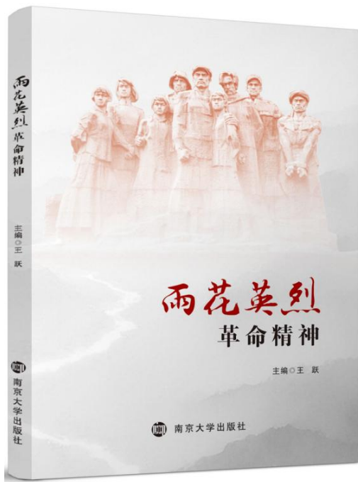
雨花英烈革命精神