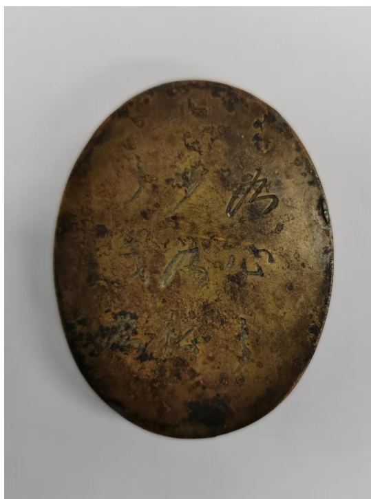
汤万益烈士使用过的墨盒

深化文物史料征集。统筹“四位一体”特色征集体系建设，赴北京、上海、苏州、无锡、镇江等多地“图档博”场馆开展地毯式查档征集，全年共征集到恽代英与李求实等人的合影照片等涉及 60 余位烈士的文物史料及陵园相关资料 1377 件/套。