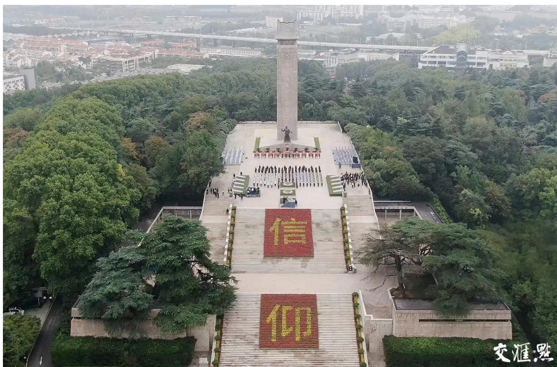
江苏省暨南京市各界向雨花台烈士敬献花篮仪式

举办主题活动。 配合举办江苏省暨南京市各界向雨花台烈士敬献花篮活动，举办“雨花·清明祭”、南京市新婚夫妇向革命烈士献花等活动。联合17所大中小学开展纪念抗战胜利80周年“抗战记忆 青春使命——国旗下讲话”特色活动。雨花英烈事迹宣讲团开展“七进”宣讲153场。举办5期暑期红色研学夏令营，“信仰的力量”——雨花英烈事迹宣讲团沉浸式宣讲获评第四届文博社教案例宣传展示活动宣传讲解类优胜案例。