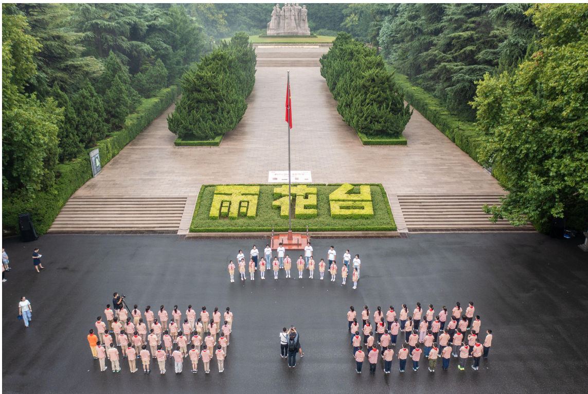
纪念抗战胜利80周年“抗战记忆 青春使命——国旗下讲话”特色活动

之歌”音乐思政系列课程，联合全市大中小学举办缅怀雨花英烈主题音乐会、主题音乐汇演，并获评2025年江苏省基层思想政治工作典型案例。