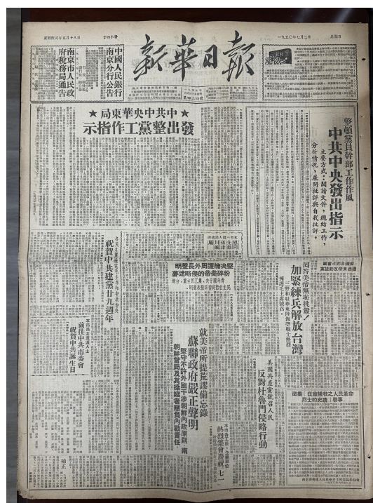
1950 年 7 月 2 日《新华日报》

加大文物保护力度。《全国重点文物保护单位雨花台烈士陵园保护规划（2019-2035 年）》、雨花台烈士陵园烈士纪念设施保护范围获省政府批复。完成 186 件/套藏品定级申请、30 件/套藏品仿制和 1163 件/套藏品信息采集。完成园内 5 处国家级和 7 处市级文物保护单位保养维护，编制明孝陵功臣墓李杰墓石刻保护加固项目方案并获批准，文物安全防护更加严密。