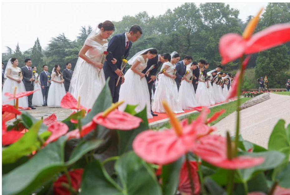
人民日报客户端：南京举行新婚夫妇代表向革命烈士献花活动